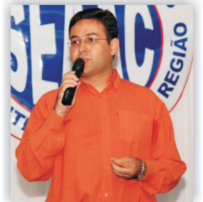
Lázaro José Eugênio Pinto presidente

Que 2010 seja um ano de realizações e renovações.